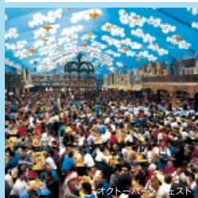
オクトーバー・フェスト