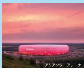
アリアンツ・アリーナ

6月よりソウル⇄ミュンヘンを週3便で運航中です。 日本全国から、ソウル経由ミュンヘンへ。 ドイツへは、大韓航空をご利用ください。